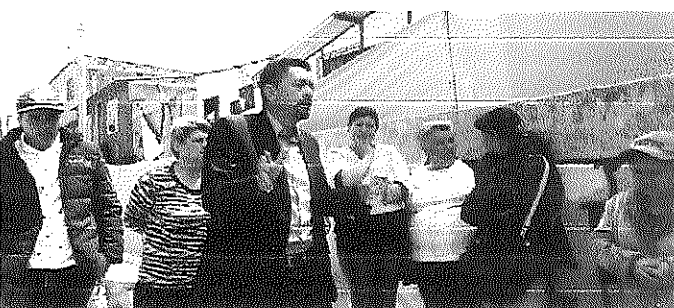
FOTO 6 MANIFESTACION DE DUDAS E INQUIETUDES.