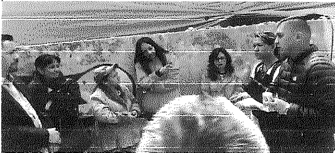
FOTO 5 ACLARACION DE DUDAS POR PARTE DEL AREA TÉCNICA