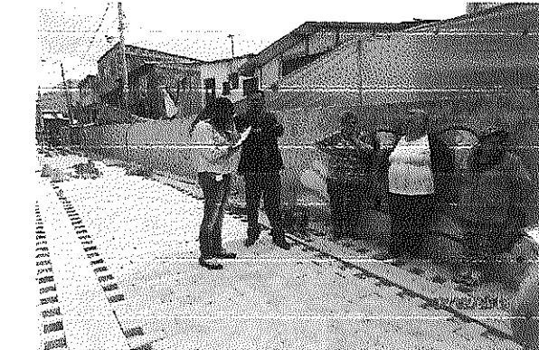
FOTO 3 INTEGRANTES DEL COMITÉ Y HABITANTES PARTICIPARON.