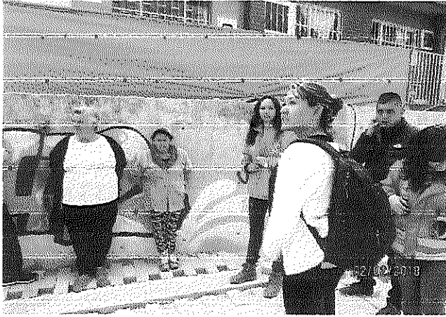
FOTO 1 QUINTO COMITÉ DE VEEDURIA EN FRENTE DE OBRA.