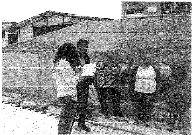
FOTO 2 ASISTENCIA DE COMUNIDAD DEL FRENTE DE OBRA.