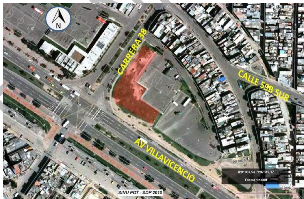
Imágenes: Localización del Proyecto: (localidad, zona, predio)