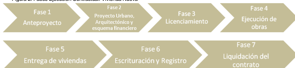
Figura 2. Fases Ejecución Contractual. Vivienda Nueva