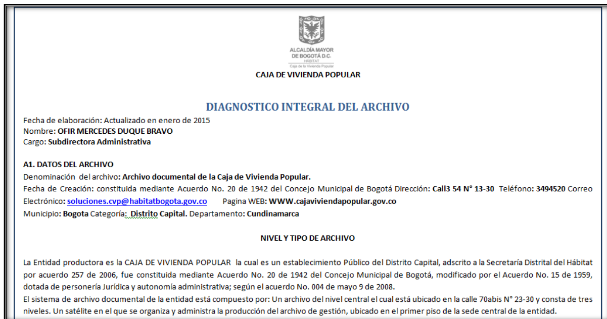
Figura 4. Pantallazo de la última actualización de Diagnóstico Integral de Archivo Enero de 2015.

Nota: Este documento se encuentra en los Archivos de la Oficina del Grupo de Gestión Documental de la Caja de la Vivienda Popular. CVP.