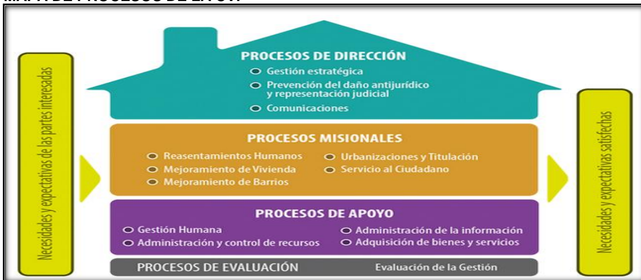
Figura 6. Mapa de Procesos CVP 2015.