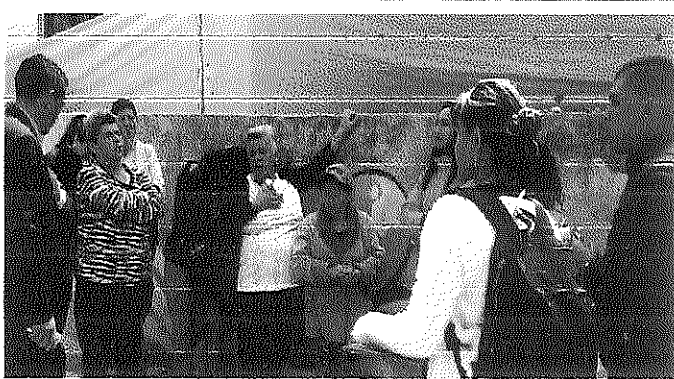
FOTO4 MANIFESTARON MULTIPLES INQUIETUDES FRENTE A DISEÑO DEL PROYECTO.