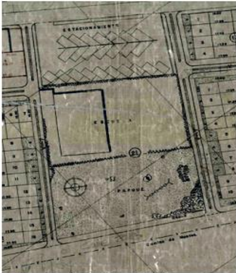
Copia parcial plano de loteo 523/4-1