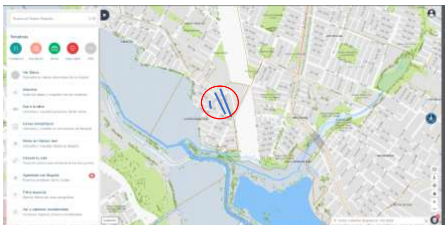
Figura 1.2. Barrio SAN FRANCISCO SUBA CENTRO (LA CAROLINA III)

La implementación de las obras se va a realizar en dos zonas de la UPL 9 – Tibabuyes, 3 CIV se ejecutarán en el barrio SAN FRANCISCO SUBA CENTRO (LA CAROLINA III), según se muestra en la Figura 1.2.