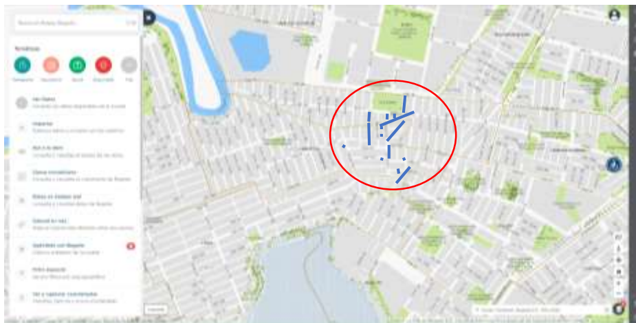
En la figura 1.3 Barrios DESARROLLO SAN PEDRO DE TIBABUYES, DESARROLLO LA ISABELA y BERLÍN

En la figura 1.2 y 1.3 se encuentran los 24 segmentos viales a intervenir en el presente proyecto, de los cuales 20 corresponden a construcción de calzada vehicular y los 4 restantes a construcción de calzada vehicular y andenes, las actividades planteadas corresponden a 4.887 m 2 de intervención.