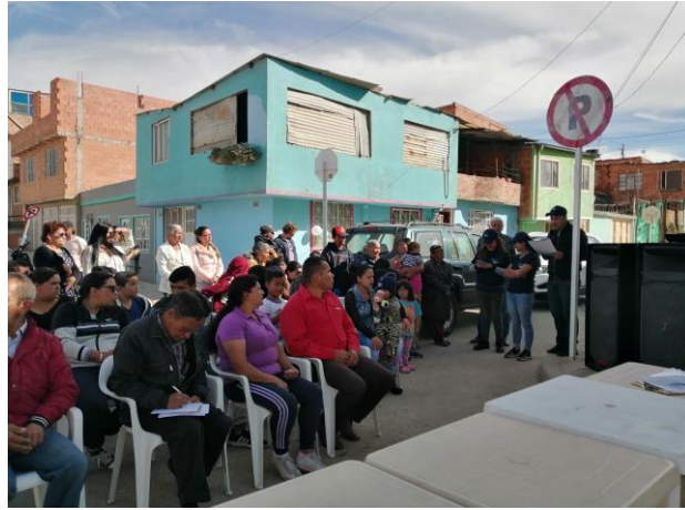
Lectura del Acuerdo de Sostenibilidad