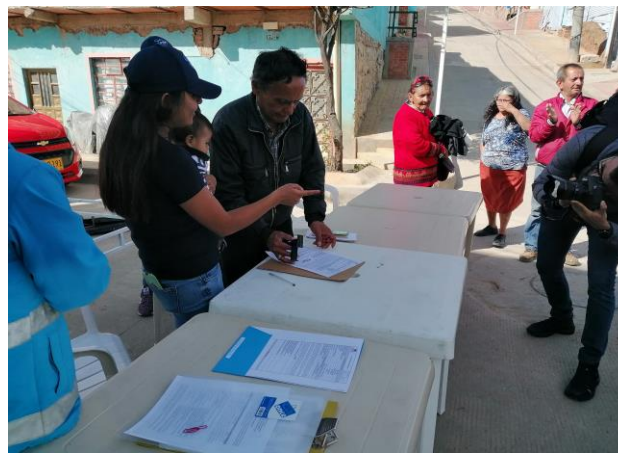
Firma del Acuerdo de Sostenibilidad