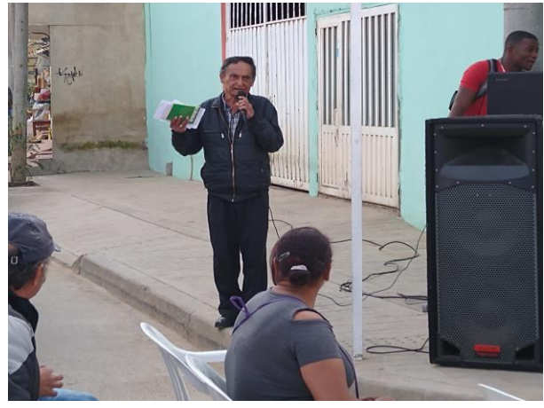
Palabras del Presidente de la JAC