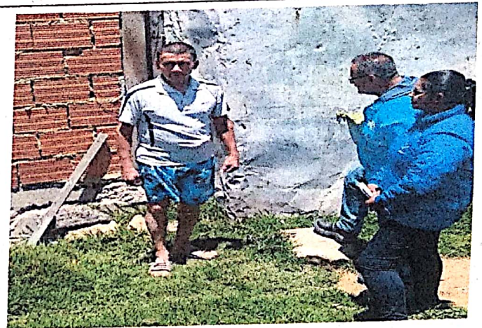
GESTIÓN SOCIAL CON COMUNIDAD - SOLICITANDO EL RETIRO DE ESTRUCTURAS QUE ESTAN POR FUERA DE SU PROPIEDAD - SE FIRMA COMPROMISOS HASTA EL 16 DE SEPTIEMBRE