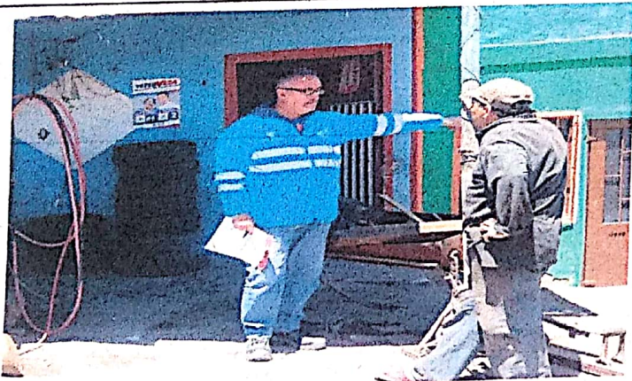
GESTIÓN SOCIAL CON COMUNIDAD - SOLICITANDO EL RETIRO DE ESTRUCTURAS QUE ESTAN POR FUERA DE SU PROPIEDAD - SE FIRMA COMPROMISOS HASTA EL 14 DE SEPTIEMBRE