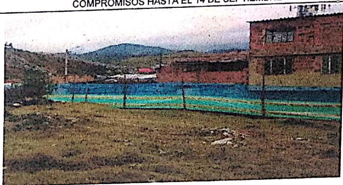
SERRAMIENTO TEMPORAL CUMPLIENDO CON COMPROMISOS DE ESPERA DE LA COMUNIDAD