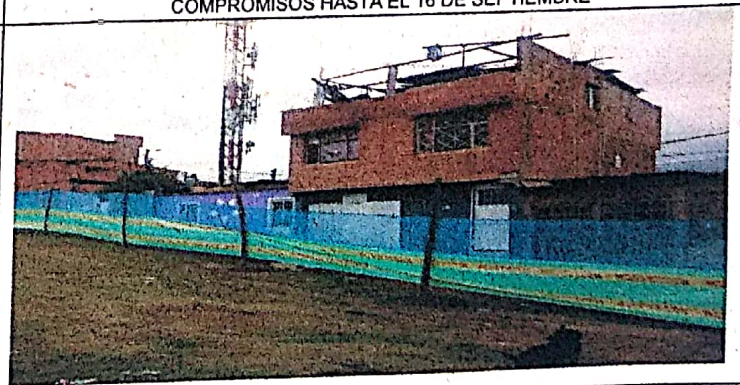
SERRAMIENTO CON EL TERRENO YA LIBRE DE AUTOS PARQUEADOS EN TERRENO