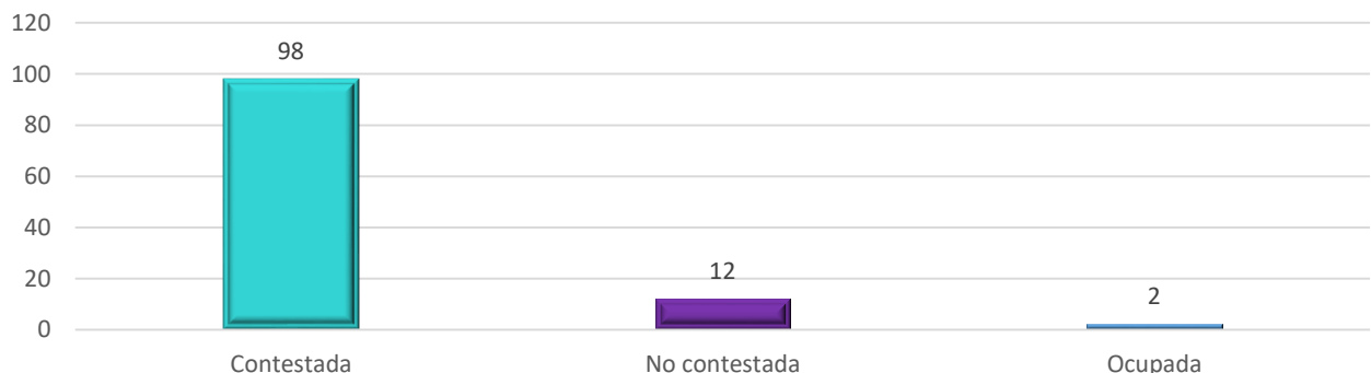
REPORTE SIMA - LLAMADAS CONTESTADAS JUNIO 2021

Los registros arrojados por el SIMA, permite establecer que, de las 112 llamadas, 12 fueron no contestadas y 2 ocupadas.