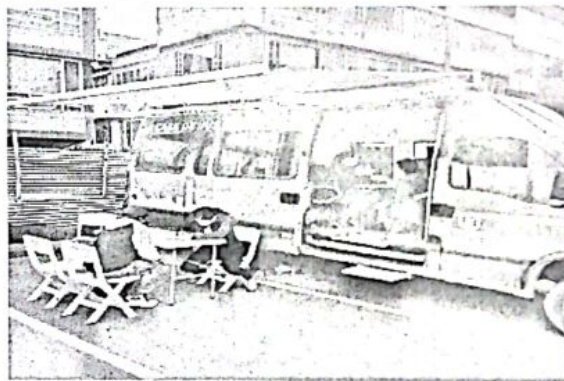
MÓVIL CASA DE LA JUSTICIA