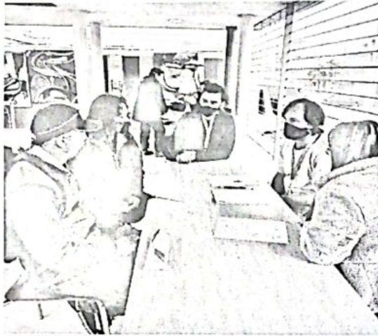
RURO – UAESP