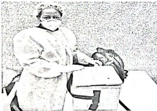
JORNADA DE VACUNACIÓN HUMANA Y ANIMAL