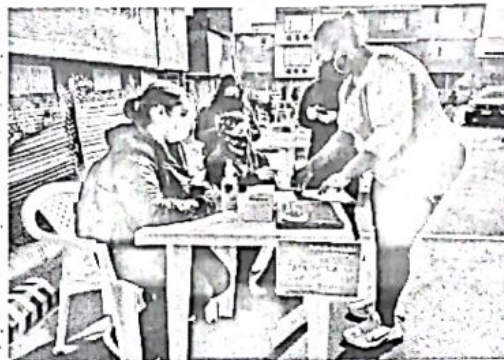
CVP – Registro de asistencia