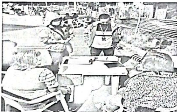
IDPAC y lideresas de Mz 55.