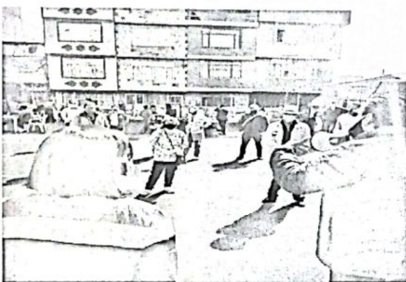
Casa de la Justicia – Oferta de servicios