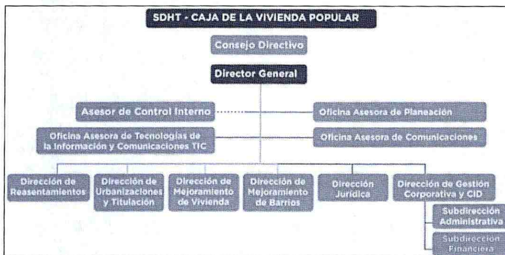
Grafica No. 1: Representación de la estructura organizacional de la CVP